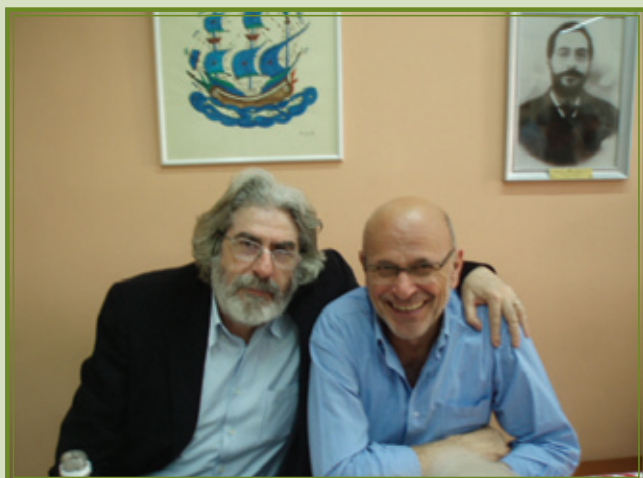
Ο ΒΟΥΛΕΥΤΗΣ ΛΕΣΒΟΥ ΤΟΥ ΚΚΕ ΣΤΑΥΡΟΣ ΤΑΣΟΣ ΜΕ ΤΟΝ ΠΡΟΕΔΡΟ ΤΗΣ ΟΛΣΑ ΧΡΙΣΤΟΔΟΥΛΟ ΤΣΑΚΙΡΕΛΛΗ