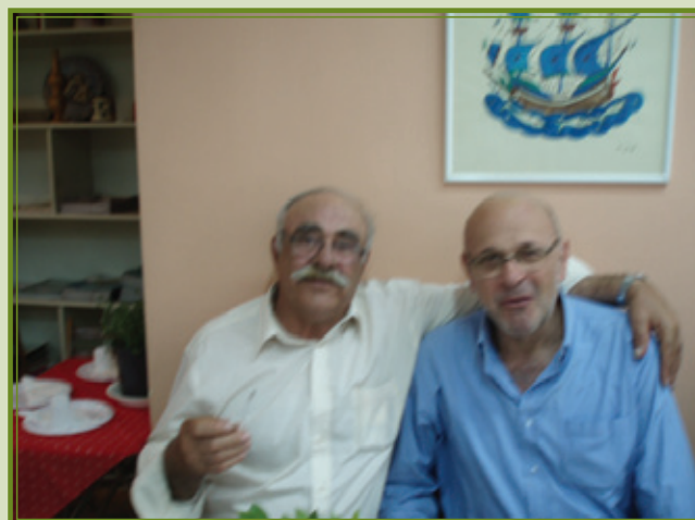
Ο ΒΟΥΛΕΥΤΗΣ ΛΕΣΒΟΥ ΤΟΥ ΚΚΕ ΣΤΑΥΡΟΣ ΤΑΣΟΣ ΜΕ ΤΟΝ ΑΛΕΚΟ ΣΑΜΑΡΑ