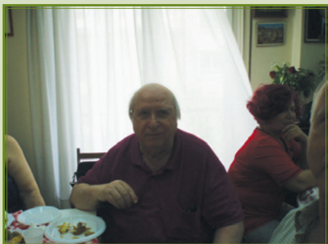
Ο ΓΕΡΑΓΩΤΗΣ ΛΟΓΟΤΕΧΝΗΣ ΔΗΜΗΤΡΗΣ ΝΙΚΟΡΕΤΖΟΣ