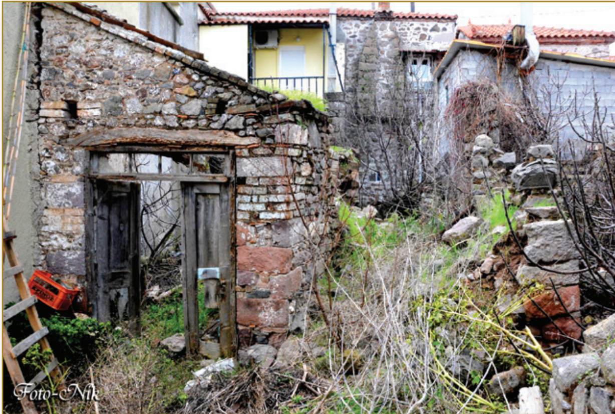
Οίκημα πίσω από το καφενείο του Κοπριτέλη. Εδώ στεγάστηκε για πρώτη φορά ο συνεταιρισμός. Από το άρθρο του Μηνά Βαξεβάνη: ΙΔΡΥΣΗ ΣΥΝΕΤΑΙΡΙΣΜΟΥ (σελ. 14)