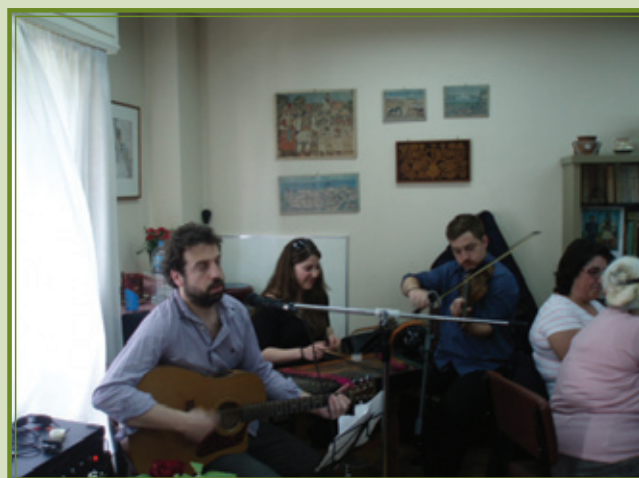
Η ΠΑΡΑΔΟΣΙΑΚΗ ΟΡΧΗΣΤΡΑ