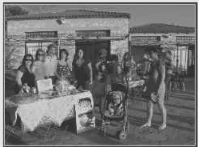
Τα μέλη του Δ.Σ του συλλόγου με το συγχωριανό τους πρόεδρο της ΟΛΣΑ στην 1η Παλλεσβιακή Συνάντηση Πολιτισμού στο άλσος Βεΐκου