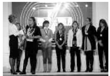
Η Κλέλια βραβεύει την Αντι

Η αρχηγός της Βουλιαγμένης παρέλαβε το βραβείο από ένα άλλο άξιο τέκνο του νησιού μας στο χώρο του αθλητισμού, τη Χαρίκλεια Πανταζή , γνωστότερη ως Κλέλια Πανταζή από τη Γέρα . Το 2000 στους Ολυμπιακούς Αγώνες του Σίδνεϊ , η Πανταζή