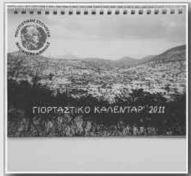
Το όμορφο καλεντάρ' 2011 του συλλόγου