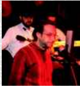
Ο νέος γραμματέας

Το Διοικητικό Συμβούλιο της ΟΛΣΑ, στην συνεδρίαση της την Τετάρτη 29 Δεκεμβρίου 2010 ,