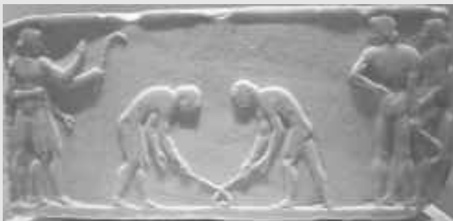
«Εφηβοί κερητίζοντες» Ανάγλυφο από βάση αγάλματος, Εθνικό Αρχαιολογικό Μουσείο

Παλαιότερα, το άθλημα παιζόταν σε πραγματικό χόρτο, το οποίο σήμερα έχει αντικατασταθεί από πλαστικό χλοοτάπητα, πράγμα που κάνει το παιχνίδι πιο γρήγορο. Μάλιστα, ο χλοοτάπητας θα πρέπει να είναι πάντα υγρός για να ελέγχεται καλύτερα η μπάλα και για να μειώνεται ο κίνδυνος τραυματισμού των παικτών όταν πέφτουν.