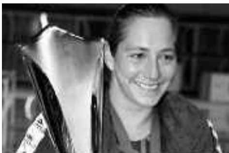
Με το τρόπαιο στα χέρια από την κατάκτηση για δεύτερη σερί χρονιά, του ευρωπαϊκού Σούπερ Καπ

Η ζωή της Αντιόπης Μελιδώνη είναι συνεχώς με τον Ναυτικό Όμιλο Βουλιαγμένης, εκεί κλείνει αισίως τα 20 χρόνια. Με καταγωγή από τη Συκαμιά από τη νητέρα της και το Σκαλοχώρι