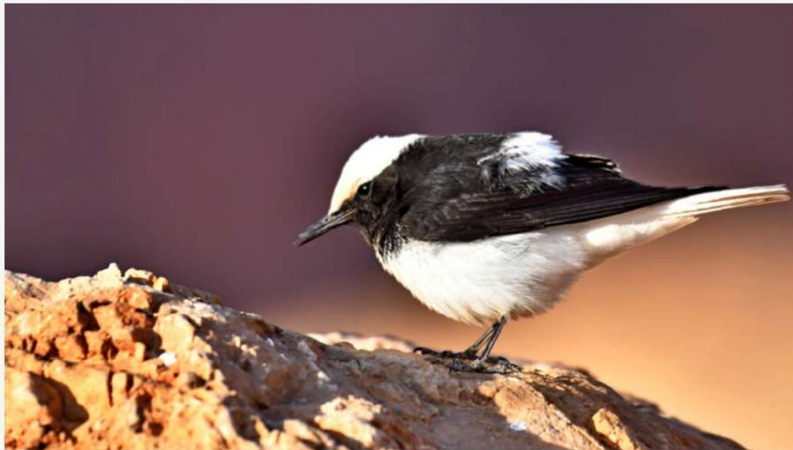
Ο πλούτος των πουλιών της Λέσβου οφείλεται σε ένα μεγάλο βαθμό στη γεωγραφική της θέση, ουσιαστικά στο