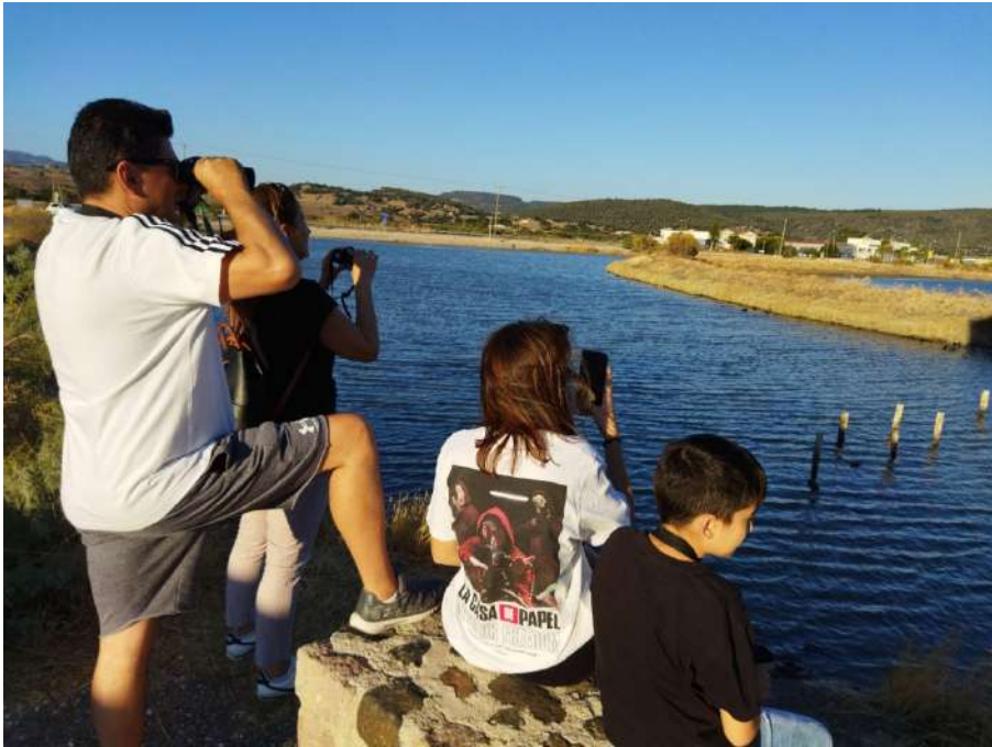
Ξεναγήσεις παρατήρησης πουλιών (Αυγ.- Σεπτ. 2021)