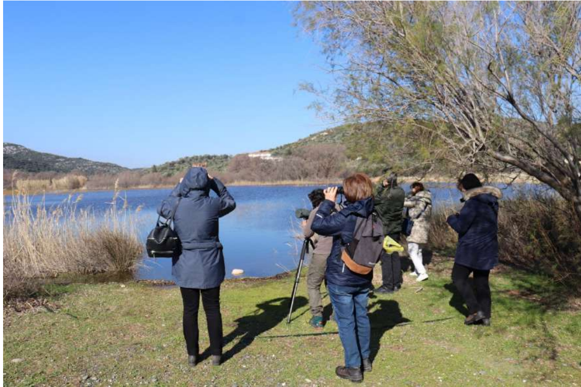
Χειμώνας - σε υγροτόπους όλης της Λέσβου