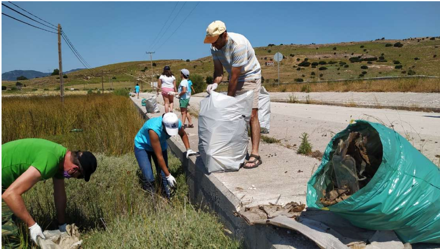
Παγκόσμια Ημέρα Περιβάλλοντος – 5 η Ιουνίου 2021